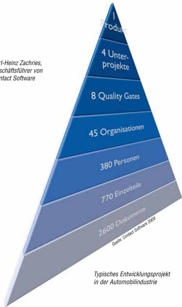
Typisches Entwicklungsprojekt in der Automobilindustrie

völlig aus. Übrigens steht diese Fehlentwicklung in engem Zusammenhang mit dem Begriff „PLM“ und den damit verbundenen Zielsetzungen. Ein wesentlicher Bestandteil einer PLM-Strategie ist es, alles entlang des Produktentstehungsprozesses zu integrieren, um so die Durchgängigkeit der Prozessketten zu erhöhen. Diese Zielsetzung muss man kritisch hinterfragen.